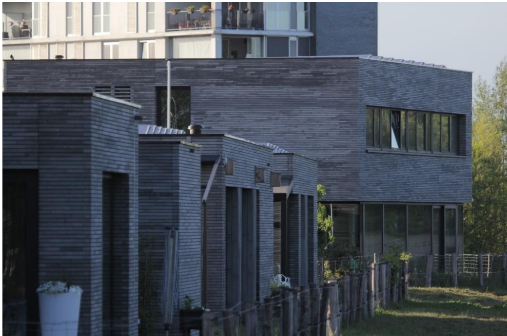
project De Commons in Tilburg

In Eindhoven troffen we hetzelfde beeld: wel rondscherende gierzwaluwen aanwezig, maar nog geen interesse in de inbouwkasten. Dat wil niet zeggen dat er niet genoeg interessants te zien was. Bij project Vredeoord heeft een spreeuw zijn nest gebouwd in de behouden bomenlaan. En vrijwilliger Ella (lees haar verhaal verderop in deze nieuwsbrief) heeft ook al de eerste huismussen in de buurt gespot. Dat is goed nieuws voor een wijk die een jaar geleden nog in de steigers stond. Bij het Vredesplein zijn de kasten ook al gevonden door huismussen. Eindhoven timmert ook naast het project B5 goed aan de weg met natuurinclusief bouwen, mede dankzij de vrijwilligers van Trefpunt Groen. Naast de B5 locaties hebben we samen met Frans Hijnen en Jacqueline van Heek verschillende projecten bezocht waar met succes natuurinclusief gebouwd is.