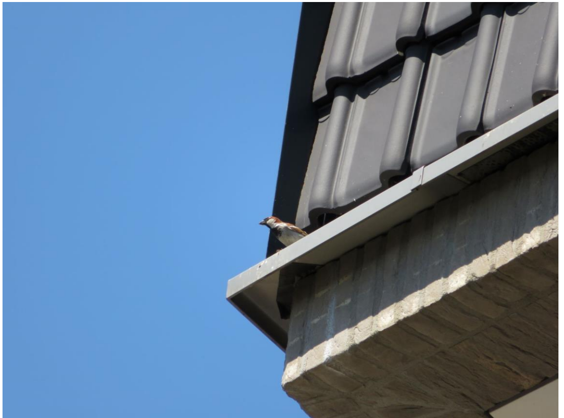
Huisemus op het Nieuwe Vredesplein

Ik ben nog maar net begonnen, maar ik vind dit erg veelzijdig en leuk vrijwilligerswerk. Ik heb in minder dan een week mijn stad op een heel nieuwe manier leren waarderen. En ik hoop dat ik bij de volgende rondjes Eindhoven op de handbike al meer gebruikte kastjes zie.