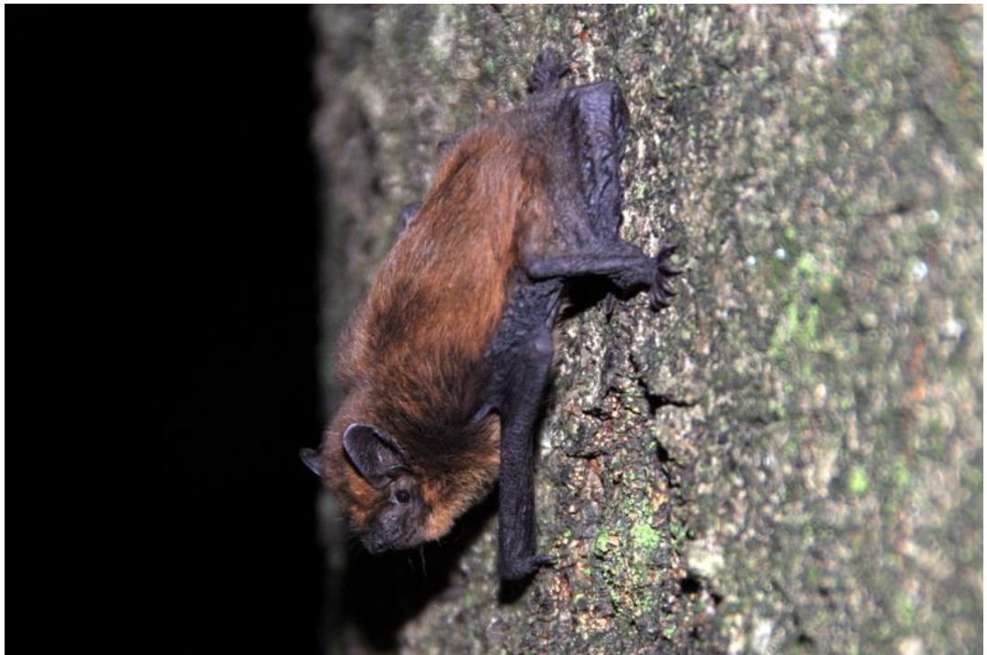
Gewone dwergvleermuis