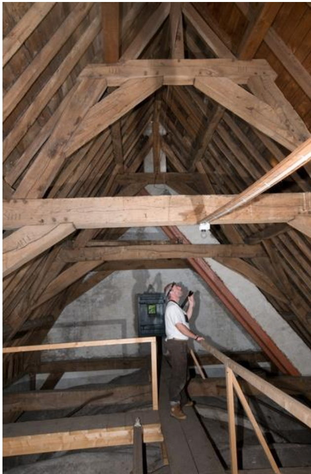
Kerkzolder (Johannes Regelink)

NB: Uiteraard nemen we de geldende regels rondom het COVID-19 virus in acht. Voorlopig gaan we ervan uit dat het bezoeken van een kerk met een klein groepje mensen mogelijk zal zijn.