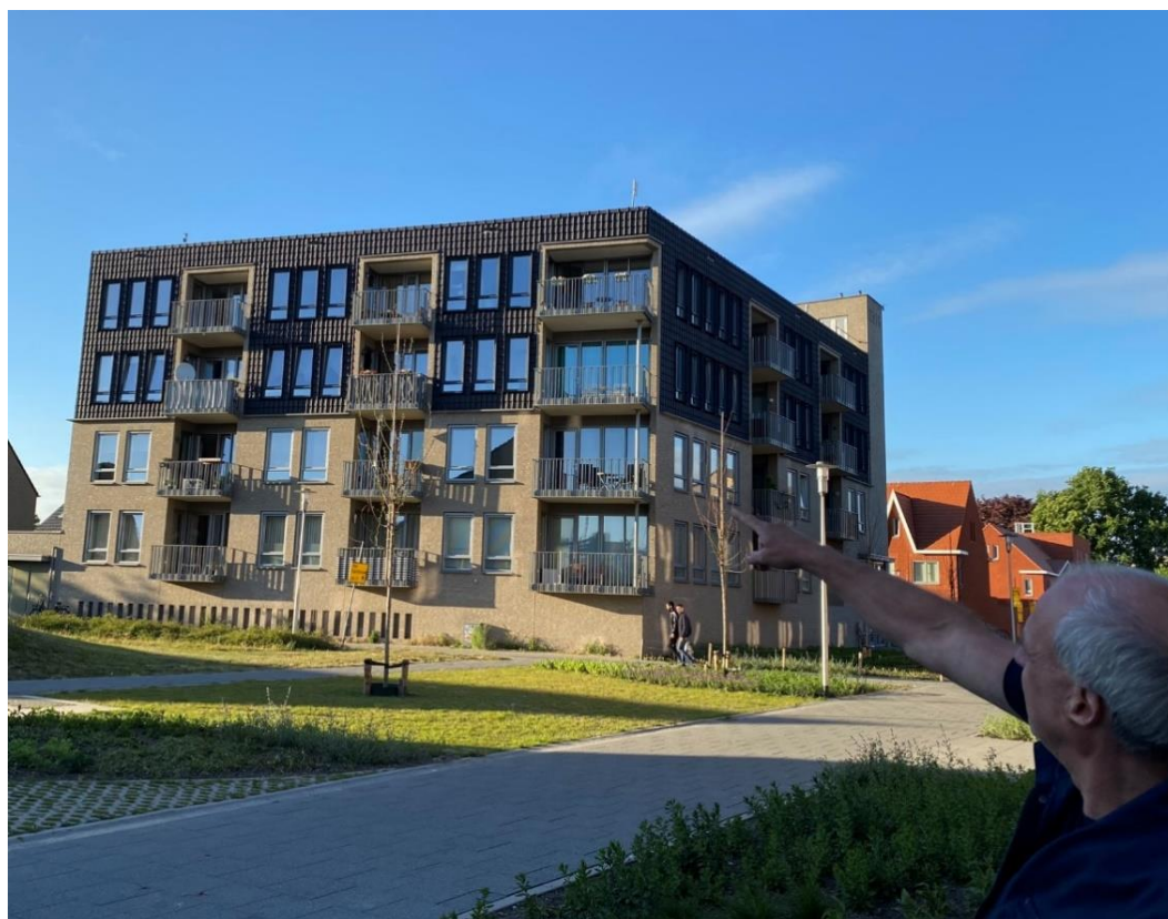
Eindhoven Vredesplein, huismussen onder de pannen