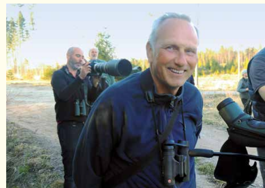
"De populariteit van vogels kijken heeft een enorme stimulans gekregen door fotografie."

Naar buiten, met de kijker Eerlijk is eerlijk, er gaat pas echt een wereld voor je open als je eropuit gaat, daarvan ben ik overtuigd. Naar buiten dus, met een kijker. Probeer de beste te kopen die je budget toelaat. Door goed te kijken en te luisteren, open te staan voor het onverwachte, zul je alsmear meer ontdekken. Juist dat ontdekken, verwonderen en kennis opdoen maakt vogels kijken intens en bevredigend. Het mooie is ook: je blijft leren. Het wordt de beginnende vogelaar tegenwoordig steeds makkelijker gemaakt door goede gidsen, online cursussen en apps die aan geluid en beeld vogelsoorten herkennen (zoals Merlin of OBS Identify). Alleen het herkennen van vogelsoorten aan hun kleed, gedrag en geluid kan al voldoening opleveren. Veel vogelaars doen niet anders. >>