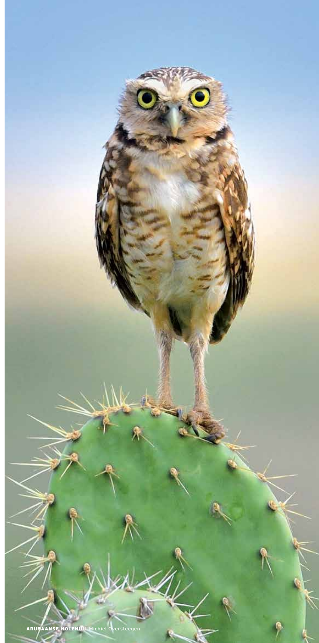
ARUBAANSE HOLENUIL Michiel Oversteegen

> ARUBAANSE HOLENUIL Op Aruba leeft de shoco, ofwel de Arubaanse holenuil. Deze prachtige vogel is er heel geliefd, maar ook erg kwetsbaar waardoor er mogelijk nog maar 100 broedparen leven. Omdat er veel gebouwen bijkomen op het eiland, gaat er gebied verloren waar ze hun nest kunnen maken. De holenuilen broeden in een nest onder de grond. Ook hebben ze te lijden onder 'off-roading', ofwel door de natuur rijden met de auto. Arubaanse natuurbescher-