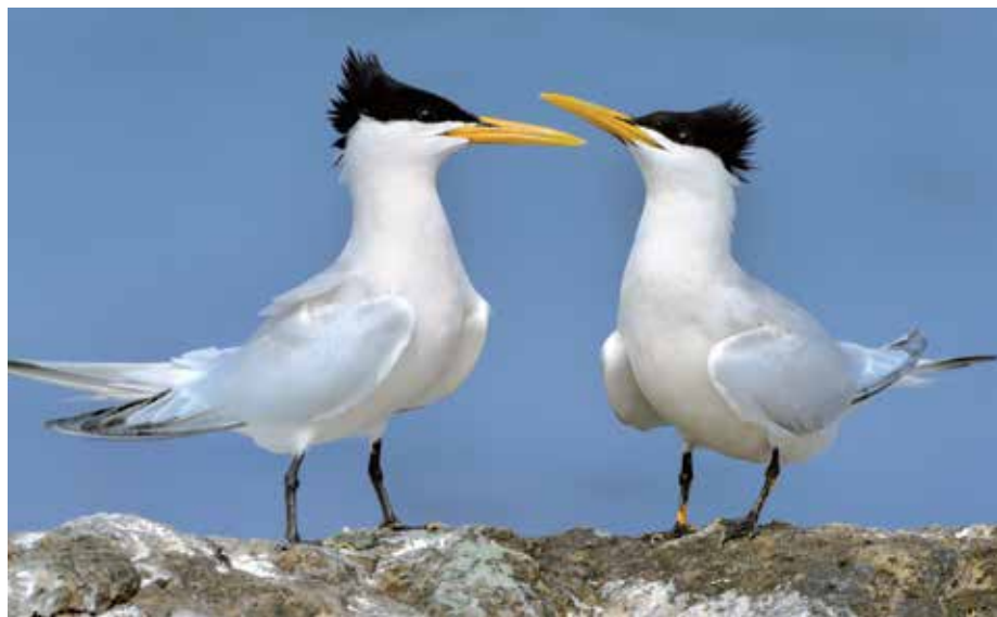
CAYENNESTERN Michiel Oversteegen

Niemand wil daar zwemmen of varen, dus de vogels zitten er graag. Helaas wordt er dicht bij de eilandjes een groot hotel gebouwd. Weg rust. Vogelbescherming helpt de natuurbeschermers op Aruba om voor de sterns op te komen. Een belangrijk