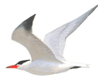
Reuzenster Grutte klikstirns