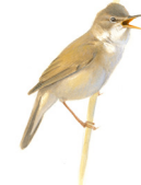
Kleine karakiet Karrekt