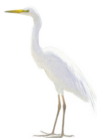
Grote zilverreiger Grutte wite reager