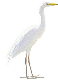
Grote zilverreiger Grutte wite reager