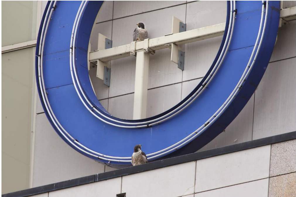
Slechtvalken; echt stadsnatuur, daar doen we het allemaal voor.

"Jazeker, twee soorten zelfs: de gierzwaluw en de slechtvalk. Maar soms bijten die elkaar, letterlijk. Bij het schoonmaken van de slechtvalkkasten en het ringen van de jongen komen we wel eens gierzwaluw veertjes tegen. Echt stadsnatuur, daar doen we het allemaal voor."