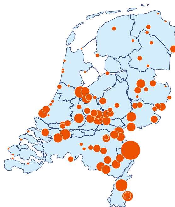
Figuur 2. Verspreiding van trekkende Gaaien over Nederland, najaar 2010. Weergegeven zijn uurgemiddelden van 20 september - 17 oktober op trekposten.