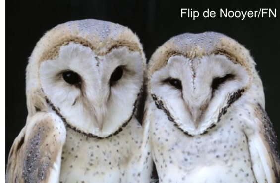
Flip de Nooyer/FN

Deze uil lijkt veel spookachtiger dan de andere uilen. Dat komt door zijn witte "sluier" (gezicht) en de zwarte ogen. Bovendien zijn sommige kerkuilen ook nog eens wit op hun buik en ondervleugels. De bovenkant is geelbruin met grijze vlekjes. De kerkuil broedt graag in schuren en kerktorens. Een goede nestplaats alleen is niet voldoende. Er moet ook veel voedsel te vinden zijn (muizen). Het liefst jaagt hij langs heggen, ruige grasbermen en houtwallen. In de moderne landbouw zijn dit maar obstakels. Daarom verdwijnt dit landschap steeds meer. Daar komt nog bij dat moderne schuren en kerken niet meer geschikt zijn om te broeden. Van de minstens drieduizend broedparen in de jaren zestig van de vorige eeuw waren er eind jaren zeventig nog geen 100 meer over. Door onder andere het ophangen van nestkasten gaat het nu weer beter met de kerkuilen. De laatste jaren schommelt het aantal rond de 2000 paren.