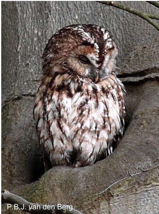
P. B. J. van den Berg

Onze grootste algemene uil. Hij is ongeveer zo groot als een zwarte kraai. De bosuil heeft een goede schutkleur: bruin of grijs gestreept. De ogen zijn koolzwart. Omdat de bosuil een echte nachtvogel is, zul je hem vaker horen dan zien. Hij is de uil die het bekende uilengeluid maakt: hoew.....woe-woe-oe-oe. Overdag zit hij doodstil op een tak of in een holle boom; "roesten" heet dat. Hierbij komt de schutkleur goed van pas zodat hij niet zoveel gepest wordt door andere vogels. Zoals zijn naam al zegt, komt de bosuil voor in gebieden met veel bos. Maar ze broeden ook in parken en zelfs in de stad. In Nederland broeden