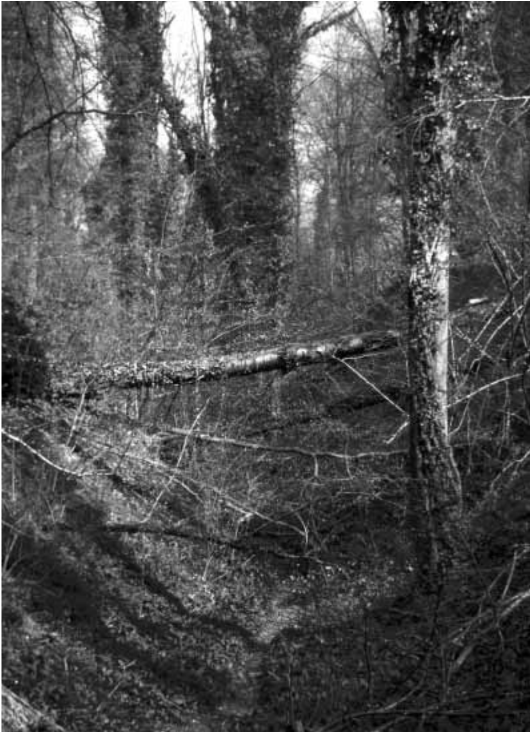
In Zuid-Limburg komen kleine aantallen Vuurgoudhanen voor in puur loofbos, uitsluitend op plekken met een weelderige structuur en veel door klimop overwoekerde bomen. De foto stamt uit het Savelsbos bij Gronsveld, waar in 1990 negen van 13 vastgestelde territoria in puur loofbos lagen (Henk Sierdsema). In the southern part of Limburg, small numbers of Firecrest breed in deciduous forest, especially when numerous trees are covered with Ivy.