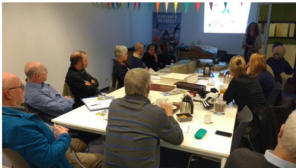
Bijeenkomst in 's-Hertogenbosch, 29 november 2017