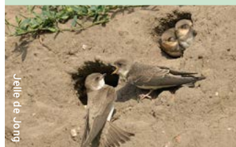
buur de jong