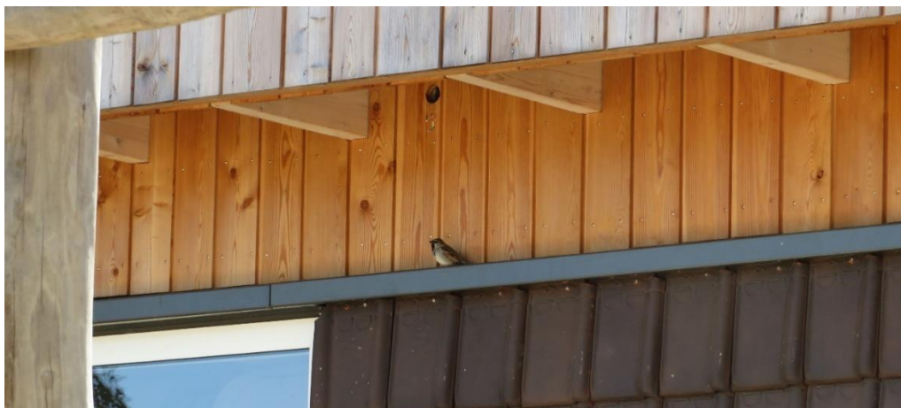
Huismus bij projectlocatie basisschool Onder de wieken, van HEVO.

middelen -in de vorm van kennisplatforms als Bouwnatuurinclusief.nl en KAN , maar ook in concrete inbouwvoorzieningen- om natuurinclusief te bouwen. Uit de vragen na afloop van beide presentaties bleek dat veel aanwezigen geïnspireerd zijn om biodiversiteit in het vervolg mee te nemen in hun projecten.