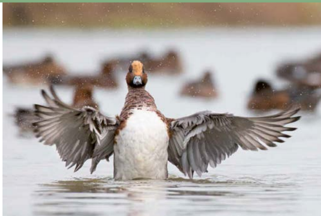
SMIERT Hans Aarssen

bedreigde soorten was nabij steden de helft minder. Volgens Holm kan de verminderde beschikbaarheid van voedsel rond steden een oorzaak zijn van het lagere aantal. Bepaalde soorten vogels zoeken hun voedsel niet alleen in het bos, maar ook in de directe omgeving daarvan. Als die omgeving uit bebouwing bestaat, dan zijn er bijvoorbeeld minder insecten beschikbaar. Ook verstoring door geluid en licht spelen een rol. Maar voor sommige vogelsoorten is een stedelijke omgeving juist aantrekkelijk. De appelvink is daar een mooi voorbeeld van. In steden staan meer fruitbomen dan in natuurlijke bossen. De appelvink weet dus precies waar hij het beste kan vinden.