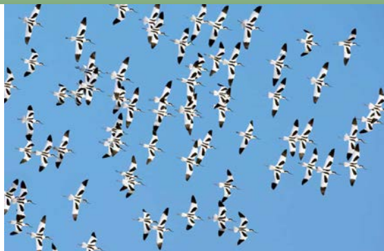
KROON Sebastiaan Kijp/Outlet-Beard

Toppers van vogelkijplekken Vlieland is een relatief klein en aangenaam aduurof eiland met maar één dorp, Oost-Vlieland. De rest van het eiland is zo'n bestje natuur en alle mooie plekken zijn op fietsafstand. Zo ook de wandeling die alles in zich heeft wat Vlieland zo mooi maakt: het Boswachterspad. Deze rondwandeling van 7,5 km is zo aanlegd dat vogels zo min mogelijk worden verstoord en voert je langs de Kroon's Polders en